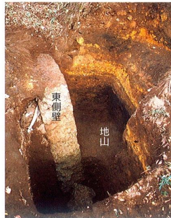
▲ 主体部の断面と掘り形