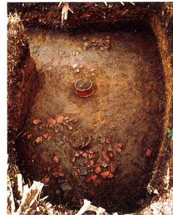
▲ 間隔が広く配置された円筒埴輪(23トレンチ)