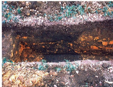
▲ 後門部(左)と前方部(右)の境の層

※ベースの図は「甲塚古墳調査報告」「栃木県考古学会誌」第11集をもとに作成しています。